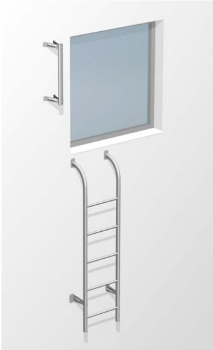
Kuva 1. Hätäpoistumistie ikkunasta.