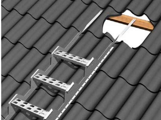
Pelti- ja huopakatto