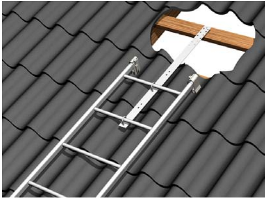
Pelti- ja huopakatto