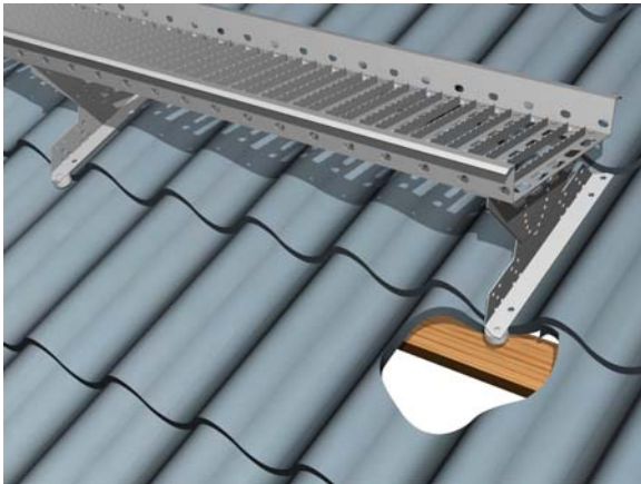
Pelti- ja huopakatto P-KAT tai H-KAT