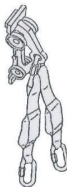
Kuva 2. Kiskotarrain ja vaimennin