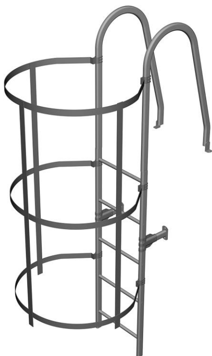
Kuva 1. Selkäkaari