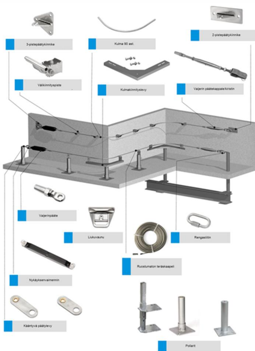
Kuva 2. Järjestelmän osat (erityisesti seinä- ja pollari kiinnityksissä).