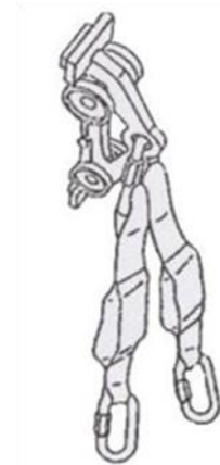
Kuva 2. Kiskotarrain ja vaimennin