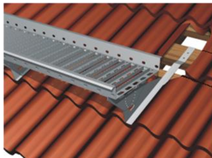
Kuva 2. TK-KAT Tiilikatolle