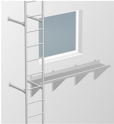
Kuva 1. Parannettu hätäpoistumistie