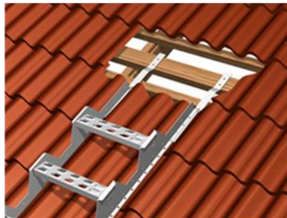
Kuva 2. Tiilikatto