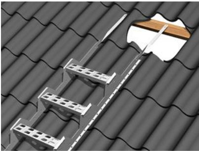
Kuva 1. Pelti- ja huopakatto