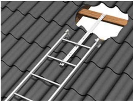
Kuva 1. Pelti- ja huopakatto katto