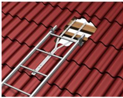
Kuva 2. Tiilikatto