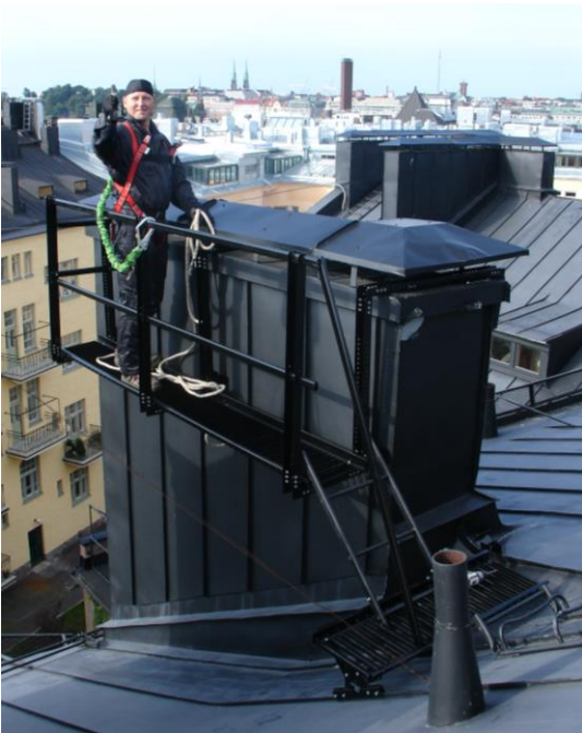
Kuva 1. Havainnekuvat