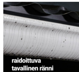
raidoittuva tavallinen ränni

Arvo-kouru tehdään aina paikan päällä räystäään mittojen mukaiseksi, jotta vältetään vuotavilta ränninjatkeilta. Arvon rakenne asettaa kourukoneelle erityisvaatimukset, jotka vain Vesivekin kourukoneet täyttävät